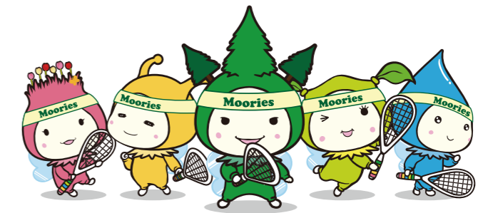
ダイナムグループ公式キャラクター「モーリーズ」

この度、エスキューブキャプテン渡辺祥広様をはじめ、関係者の皆様のご尽力により昨年に引き続き「DYNAM CUP PSA SQ-CUBE OPEN 2022 IN YOKOHAMA」が開催されますことを心より嬉しく思っております。